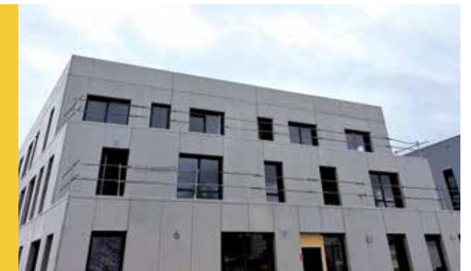
Pôle santé en construction

Le renforcement de l'offre médicale répond à un besoin concret des habitants, toutes générations confondues.