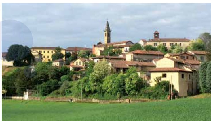
Village jumeau de Terruggia